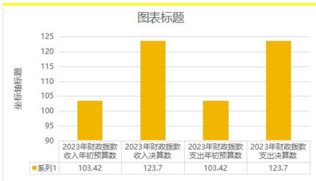
图：财政拨款收支预决算对比情况（单位：万元）

1.一般公共预算财政拨款本年收入123.7万元，完成年初预算的 119.61%，比年初预算增加20.28万元，主要原因是支出增加；本年支出123.7万元，完成年初预算的119.61%，比年初预算增加20.28万元，主要原因是支出增加。